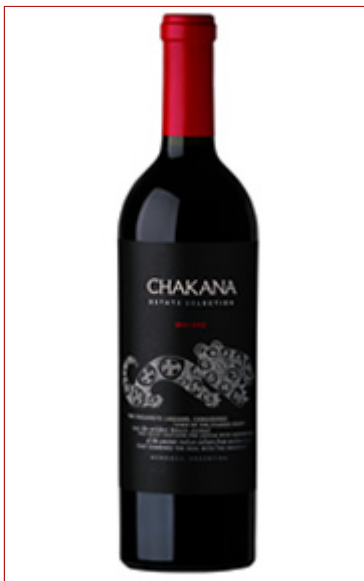
( http://www.doravidela.com.ar/vino/chakana-estate-selection-malbec-2016 )- Chakana Estate Selection Malbec 2016 ( http://www.doravidela.com.ar/vino/chakana-estate-selection-malbec-2016 )