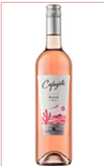
( http://www.doravidela.com.ar/vino/cafayate-rose-2016 )- Cafayate Rosé 2016 ( http://www.doravidela.com.ar/vino/cafayate-rose-2016 )