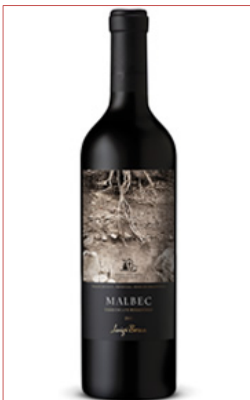
( http://www.doravidela.com.ar/vino/luigibosca-malbec-losmiradores-2015 )- Luigi Bosca Malbec Terroir Los Miradores 2015 ( http://www.doravidela.com.ar/vino/luigibosca-malbec-losmiradores-2015 )